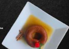
Rosquilla en miel