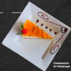
Cheesecake de Maracuyá