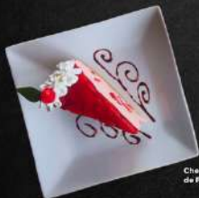
Cheesecake de Fresa